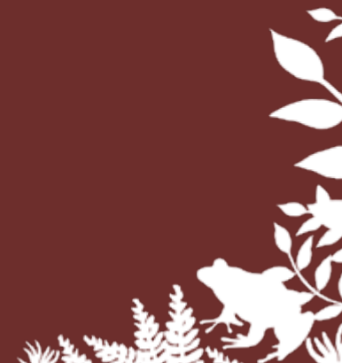
Tableau récapitulatif des actions régionales menées en faveur de la biodiversité

En complément, un index, présenté sous forme de tableau, permet de faciliter le repérage des initiatives et des catégories auxquelles elles sont rattachées.