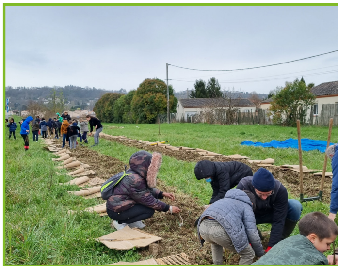
Plantation d'une haie champêtre avec les élèves de l'école Paul-Bert en mars 2022.